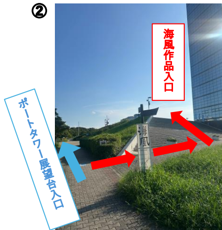
看板をすぎたら右に曲がって階段をのぼります。