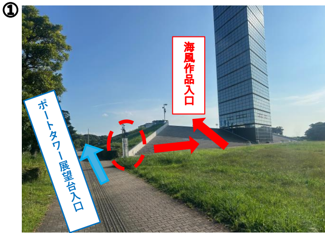
海風看板があります